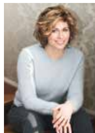
SISSEL KYRKJEBØ (sang)

Frilanser og pedagog med mastergrad i klaver fra NTNU. Fra 2007 har han oppholdt seg mye i USA og vært en av de fremste eksponentene for norsk klavermusikk med over 150 solokonsertter der. Kavlimusiker under ViB 2014.