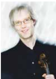
ARE SANDBAKKEN (Oslo strykekvartett)

representerer en generasjon norske musikere på et bemerkelsesverdig høyt nivå. Hun har vunnet en rekke priser, vært solist i inn- og utland. Klock spiller på en Thomas Balestrieri utlånt av Dextra Musica.