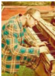
AKSEL KOLSTAD, (klaver og komponist)

En av norsk musikklivs mest sentrale personligheter. Prisbelønnet og produktiv komponist, pianist, pedagog, produsent, festivalleder og formidler. Mangeårig og kjær samarbeidspartner for Vinterfestspill i Bergstaden.