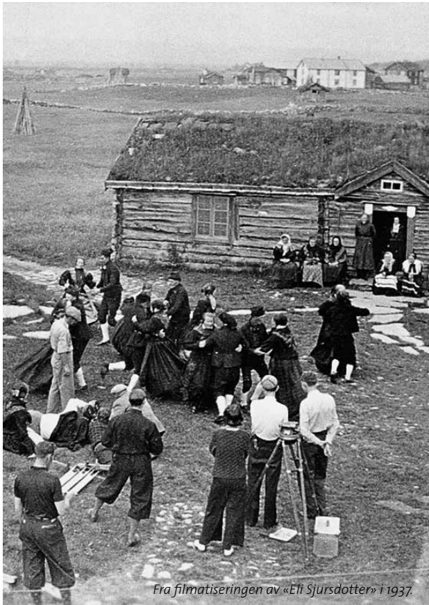
Fra filmatiseringen av «Eli Sjursdotter» i 1937.

I Eli Sjursdotter hentar Falkberget emne frå tidleg på 1700-talet. General Armfeldts tilbaketog over Tydalsfjella er det tragiske bakteppet både for det som hender og det som har grodd fast i menneskehjarte av uforsonleg nasjonalkjensle. Ufred og krig har lagt etter seg hat til grannefolket. Det fins ikkje medynk med utsvelte, streifande dragonar som i dobbelt forstand er forakta flyktningar.